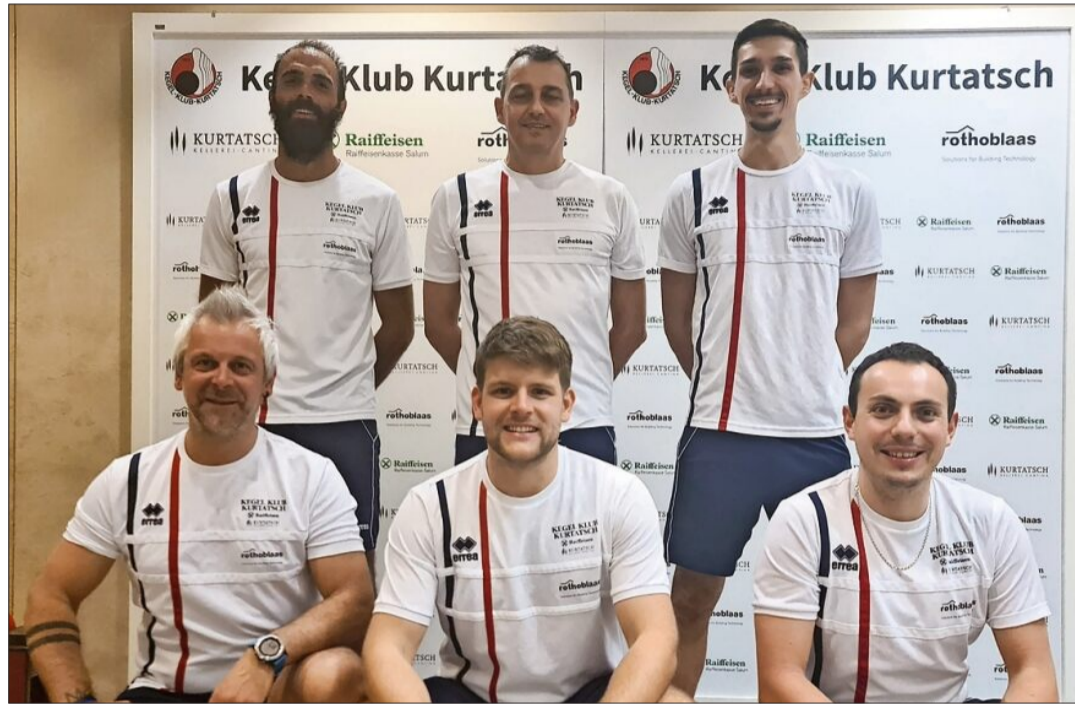
Kurtatsch war die Überraschungsmannschaft der vergangenen Saison und will auch heuer wieder überzeugen.