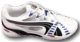
Puma Accelerate VI