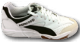
Puma Kepico 9