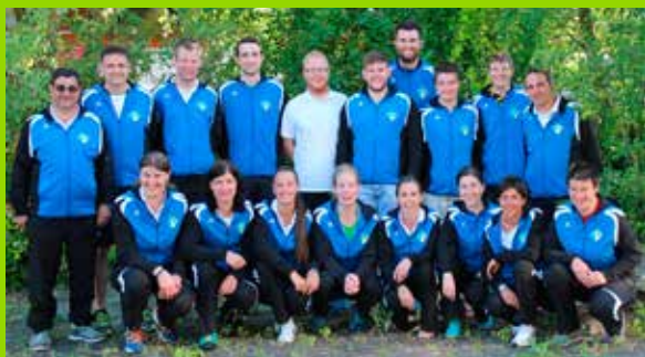
Mannschaft-WM Damen Mannschaft Viertelfinale